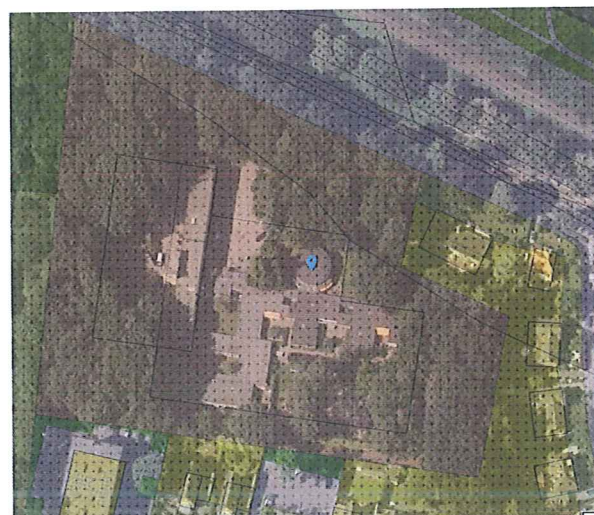
Bestemmingsplankaart met luchtfoto