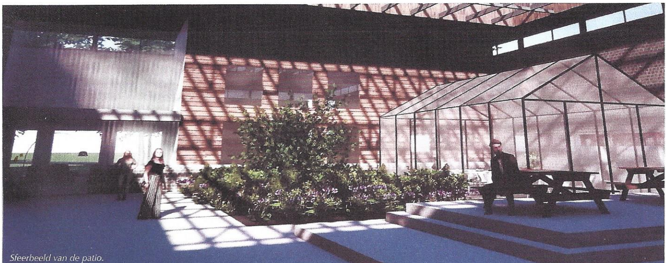
Sfeerbeeld van de patio.