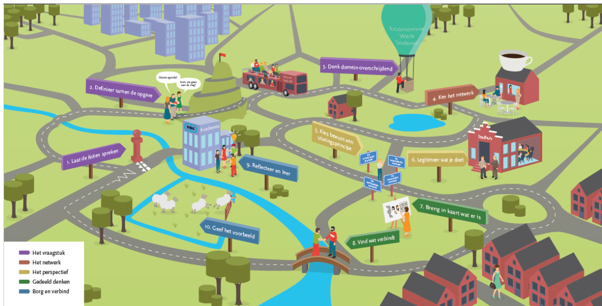
Uit: Routekaart regionale samenwerking, VNG Denktank 2018

en de energie liggen voor het grijpen. Het is nu de kunst om de behoefte aan regionale visies en agenda's te bundelen tot één gezamenlijke koers voor de langere termijn en die te voorzien van een uitvoeringsprogramma, passend bij de potentie en ambitie van de regio. En dit heeft ook gevolgen voor de wijze van sturing, want ook daar moet gebundeld worden. En voor de wijze van ondersteuning en organisatie.