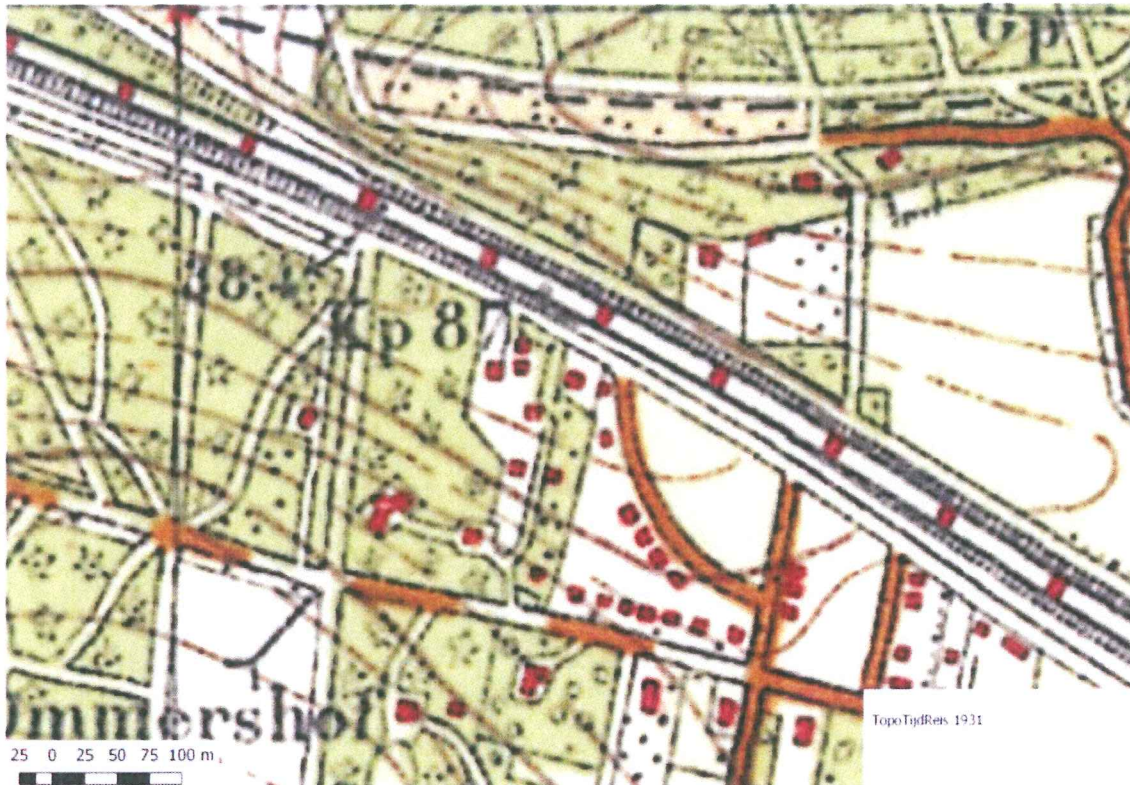
Figuur 3: Topografische kaart van het plangebied en zijn omgeving uit 1931

Op de kaarten is te zien dat de groenstructuren aan de oost- en aan de westkant van het plangebied in ieder geval meer dan 100 jaar oud zijn. We hebben hier dus te maken met volwassen ecosystemen. Op de kaart uit 1931 is te zien dat bij de bouw van woningen aan de Graaf Ottolaan de verbindingzone aan de oostkant van het huidige plangebied goeddeels intact is gebleven. De zones zijn derhalve te karakteriseren als groene zones die zich vanuit het verleden een plaats hebben verworven binnen de nu bestaande bebouwde omgeving.