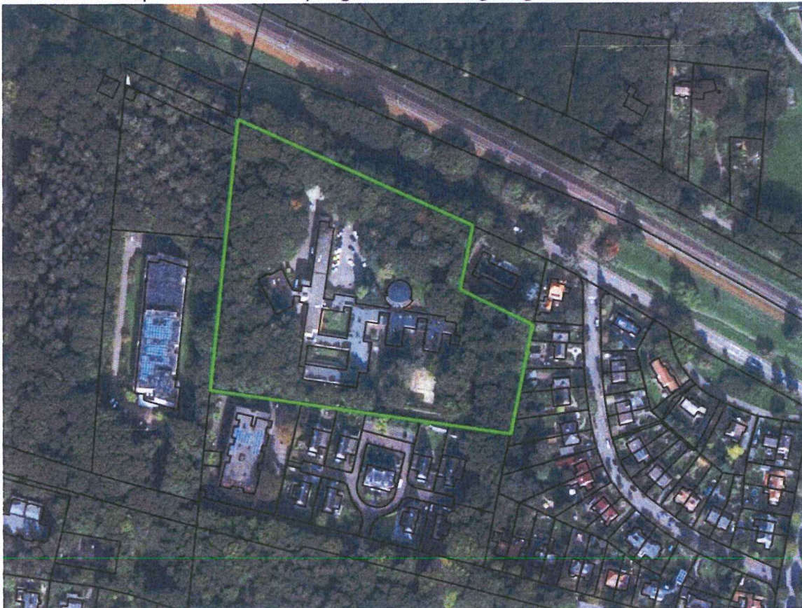
Figuur 1: Luchtfoto met kadastrale perceelsgrenzen omgeving Nico Bovenweg 44

Onderstaand is op een luchtfoto het plangebied en de omgeving ervan te zien.