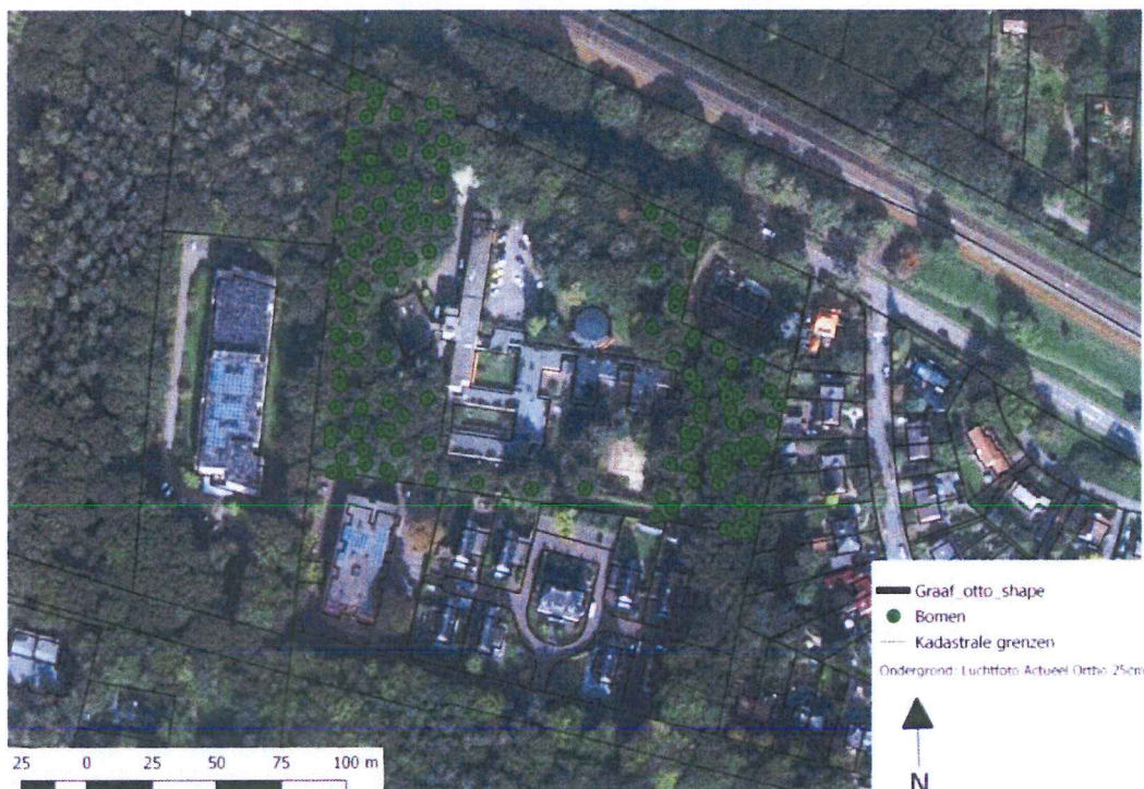
Figuur4: Luchtfoto waarop de bomen in het plangebied staan aangegeven die behouden dienen te blijven

Op onderstaande luchtfoto zijn de bomen ingetekend die bij uitvoering van het hierboven geformuleerde voorstel in ieder geval behouden dienen te blijven. Alleen de relevante bomen in het plangebied zijn ingetekend. Het spreekt vanzelf dat de bomen aan de oost- en westkant ten zuiden van het plangebied, die deel uitmaken van de verbindingzones, ook behouden dienen te blijven