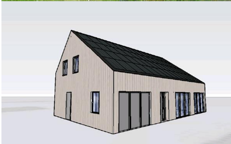
Afbeeldingen: impressies woning en omgeving (uit ontwerp-Beeldkwaliteitplan)