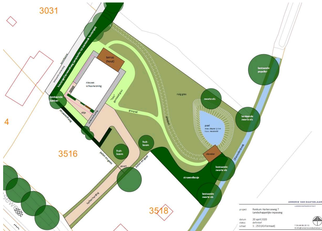
Afbeelding: landschappelijk inpassingplan