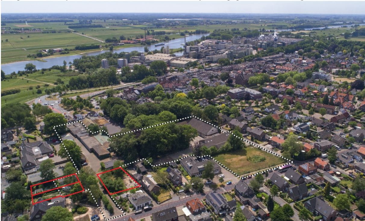
Luchtfoto (kijkrichting naar het zuiden) met plangebied. In rood globaal de 3 percelen van omwonenden

Het plangebied ligt ten oosten van de Don Boscoweg en ten zuiden van de Groeneweg in Renkum. Het ligt midden in een bestaande woonwijk en nabij het centrum van het dorp. Direct aansluitend op het plangebied liggen drie percelen van omwonenden die willen “meeliften” met het project. Het plangebied en de percelen van de drie omwonenden zijn weergegeven in de navolgende luchtfoto.