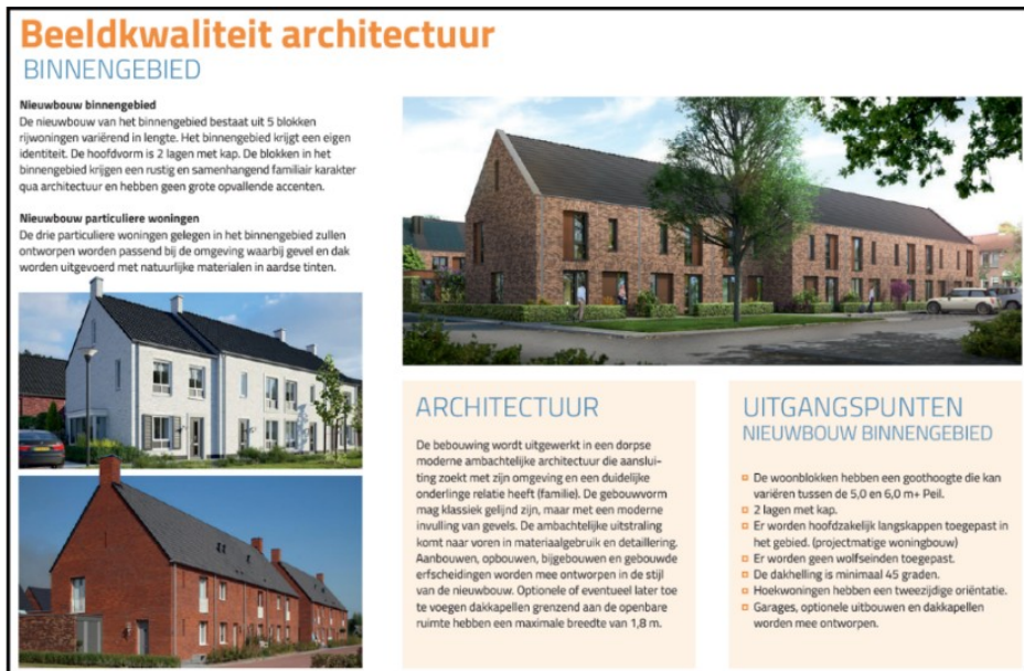
Afbeelding: deel uit beeldkwaliteitplan