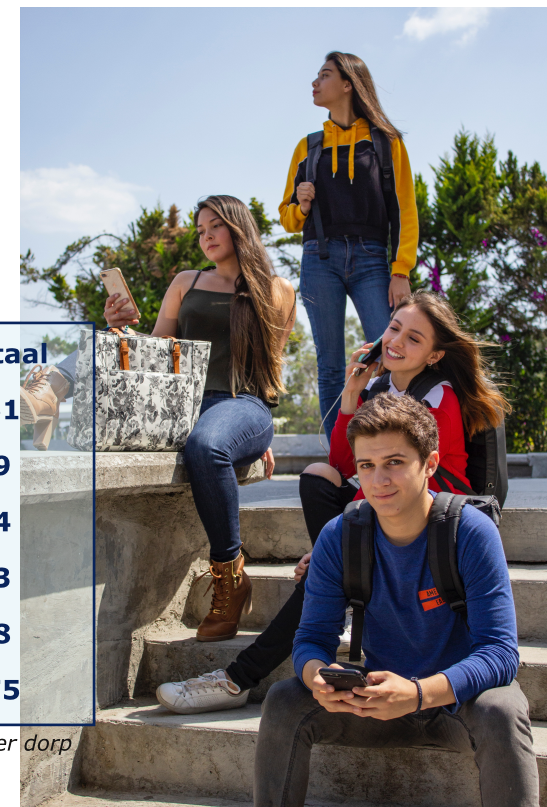
Tabel 2: soort verzuimmeldingen per dorp

De leerplichtambtenaar heeft in schooljaar 2018-2019 in totaal 8 preventieve gesprekken gevoerd, wanneer er nog geen sprake was van wettelijk verzuim, maar er wel zorgen waren.