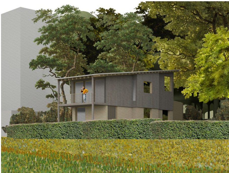
van de nieuwe woning (Bron: Studio Douwe, augustus 2023).