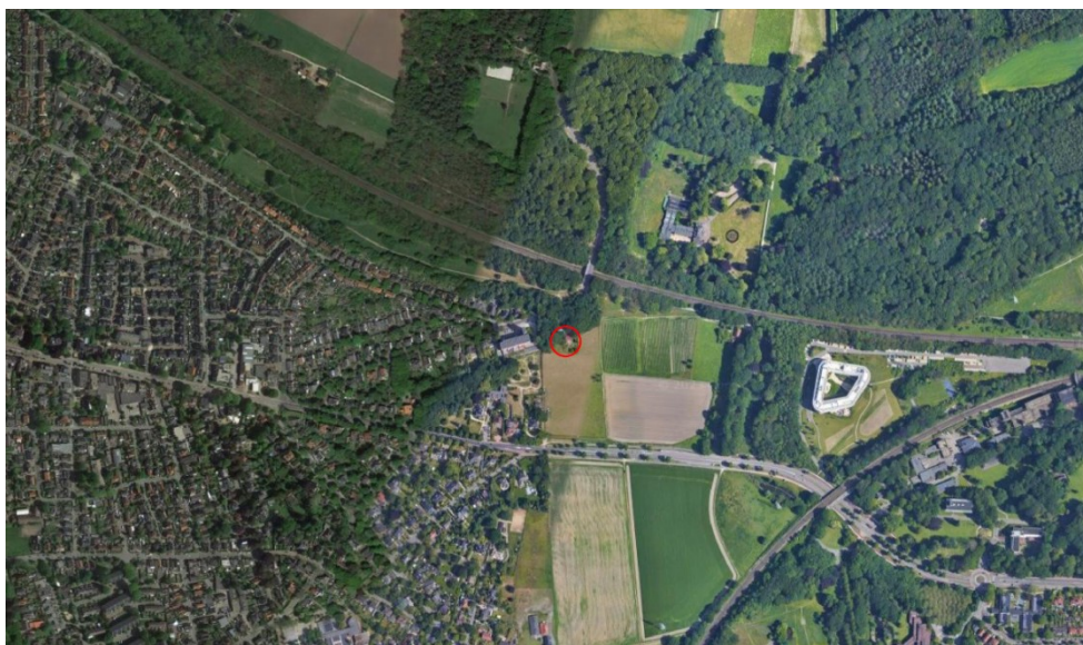
Afbeelding: Luchtfoto met globale ligging plangebied en ruimere omgeving