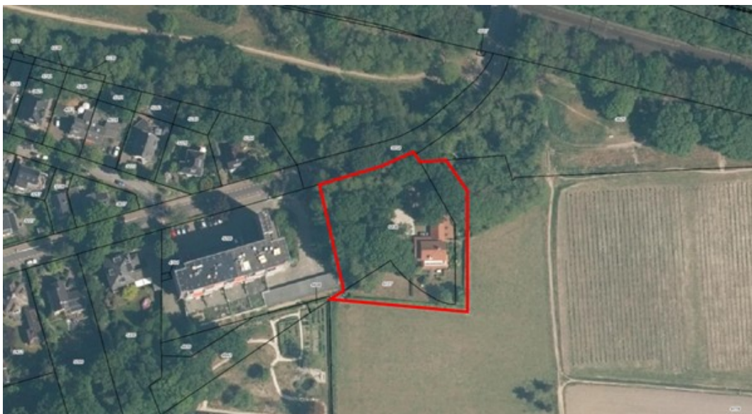
Afbeelding: Luchtfoto plangebied Schelmseweg 101 (rood = globaal plangebied)

De initiatiefnemers hebben het voornemen om op het bestaande grote perceel van de Schelmseweg 101 in Oosterbeek een tweede woning te realiseren. Dit zal plaatsvinden in het westen van de huidige woning. Hier is voorzien in een moderne woning van maximaal twee bovengrondse bouwlagen met een plat dak of een licht hellend dak.