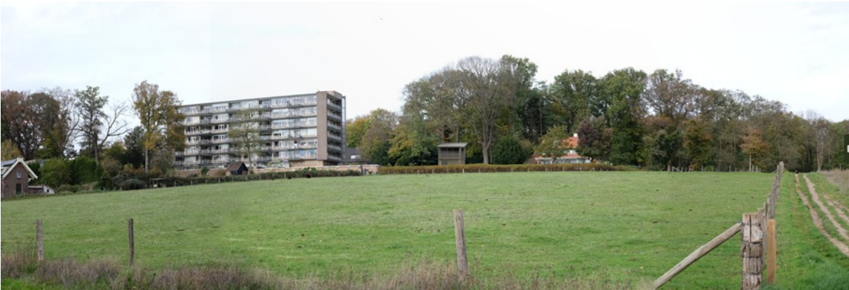
Afbeelding: Impressie Toekomstige situatie van het plangebied vanaf de Utrechtseweg (Bron: Studio Douwe, augustus 2023).