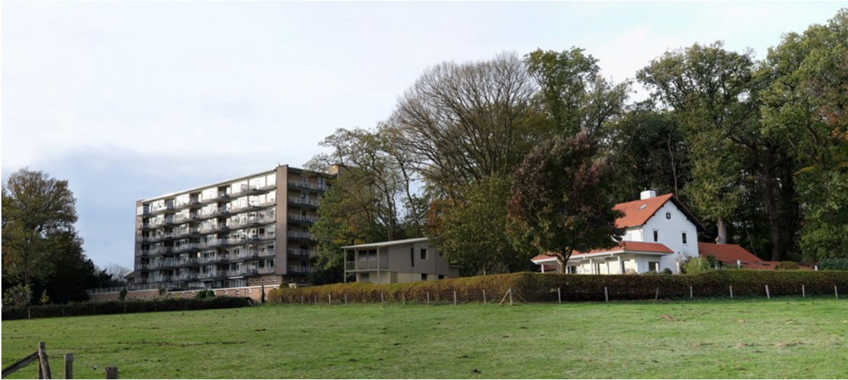
Afbeelding: Impressie toekomstige situatie van het plangebied vanaf wandelpad over agrarisch terrein. Het nieuwe pand is in omvang en kleur ondergeschikt aan het bestaande pand.