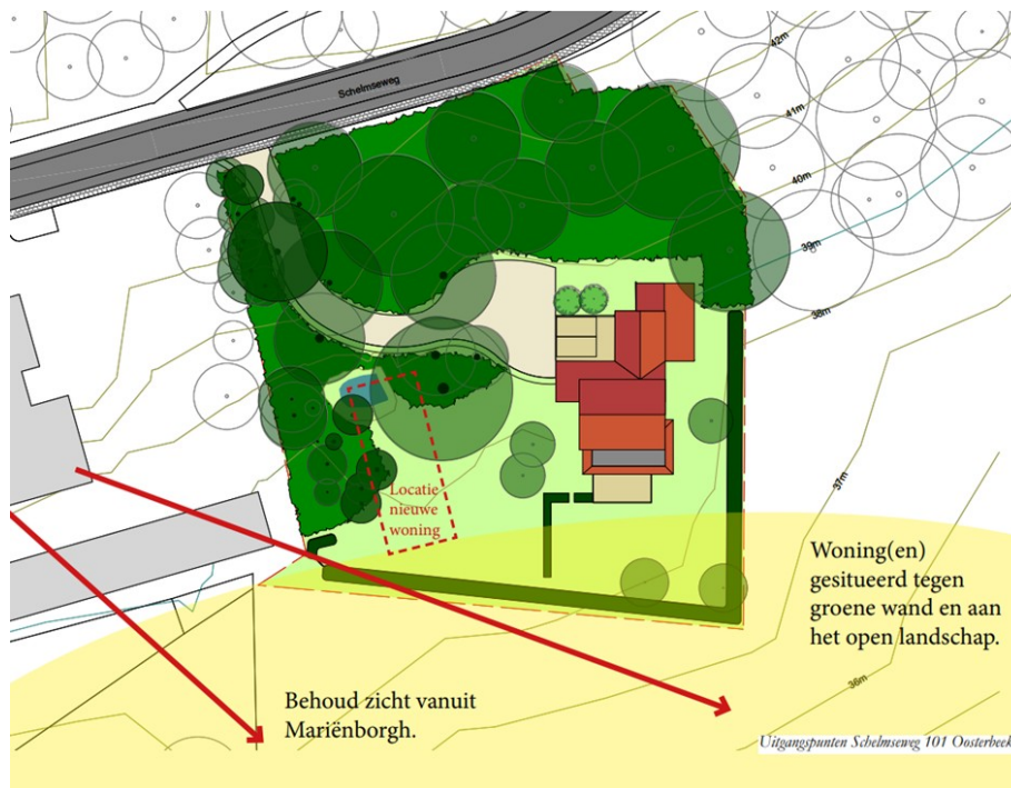
Afbeelding: Uitgangspunten voor de landschappelijke inpassing. De bestaande kwaliteiten van de omgeving blijven behouden. De nieuwe woning voegt zich in het landschap en wordt stedenbouwkundige ondergeschikt aan de bestaande woning (Annerie van Daatselaar, september 2023).

Er zijn echter geen inhoudelijke zienswijzen ingediend over de bouw van de nieuwe woning. De ingediende zienswijze leidt daarmee niet tot een ander plan, maar wel tot een zeer kleine aanpassing van het vast te stellen bestemmingsplan. Daarom wordt geadviseerd om het bestemmingsplan gewijzigd vast te stellen.