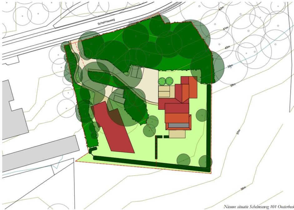
Afbeelding: Schets van de beoogde situering van de nieuwe woning met een natuurlijke afscherming tussen de woningen (Annerie van Daatselaar, september 2023).