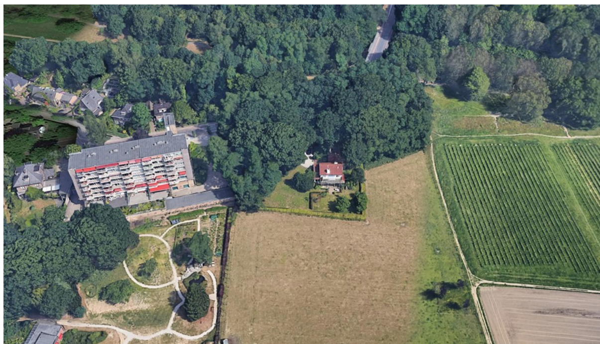
Afbeelding: Bestaande situatie van het plangebied vanuit de lucht. Kijkrichting naar het noorden (Bron: Studio Douwe, 23 februari 2023).