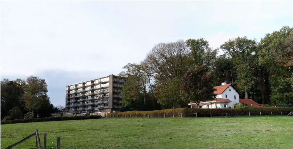
Afbeelding: Bestaande situatie van het plangebied vanaf wandelpad over agrarisch terrein.