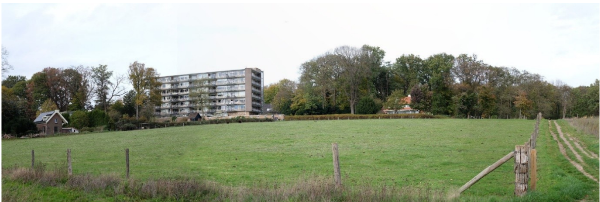
Afbeelding: Bestaande situatie van het plangebied vanaf de Utrechtseweg. (Bron: Studio Douwe, 23 februari 2023).

De ontwikkeling past niet binnen de mogelijkheden van het nu geldende bestemmingsplan 'Oosterbeek-Noord 2014'. Hoewel er op het perceel een woonbestemming rust is er geen tweede bouwvlak aanwezig voor de bouw van de tweede woning.