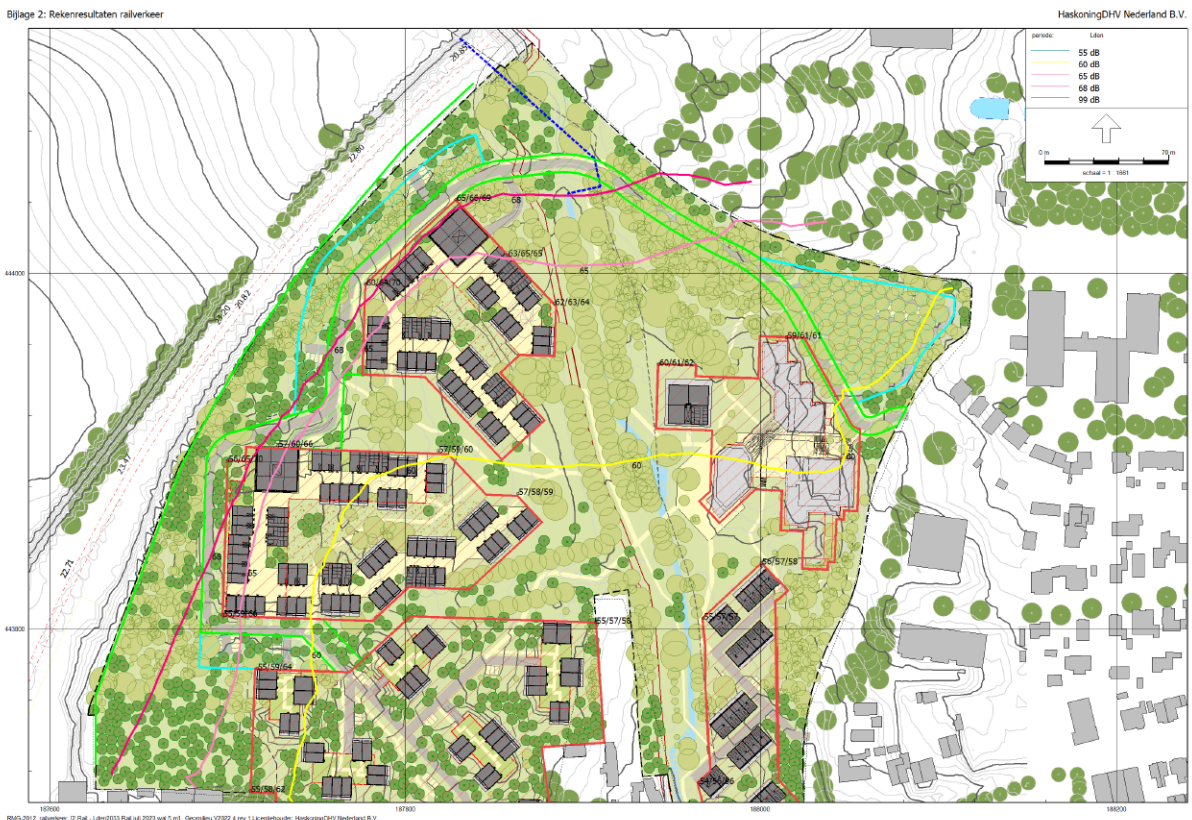
Rekenresultaten geluid railverkeer