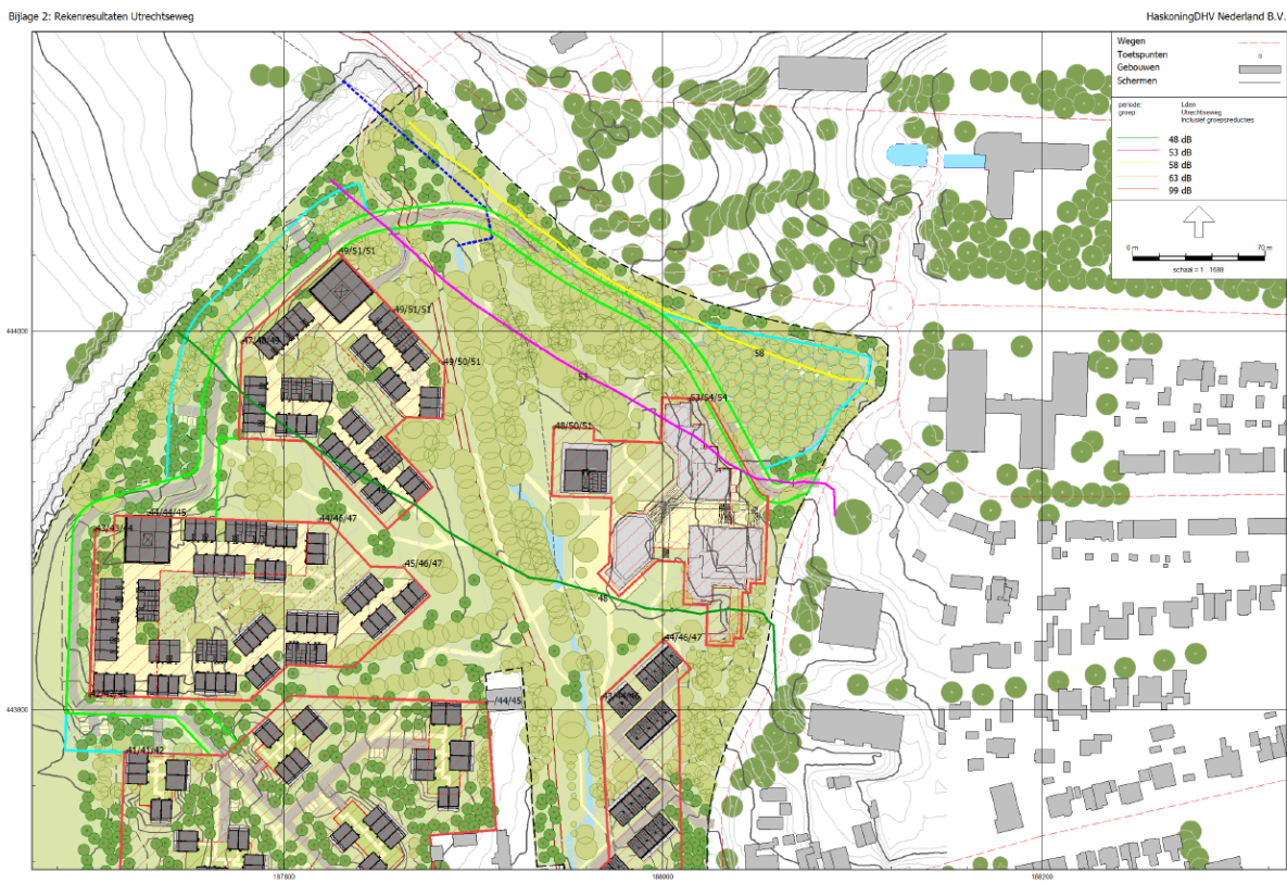
Rekenresultaten geluid wegverkeer