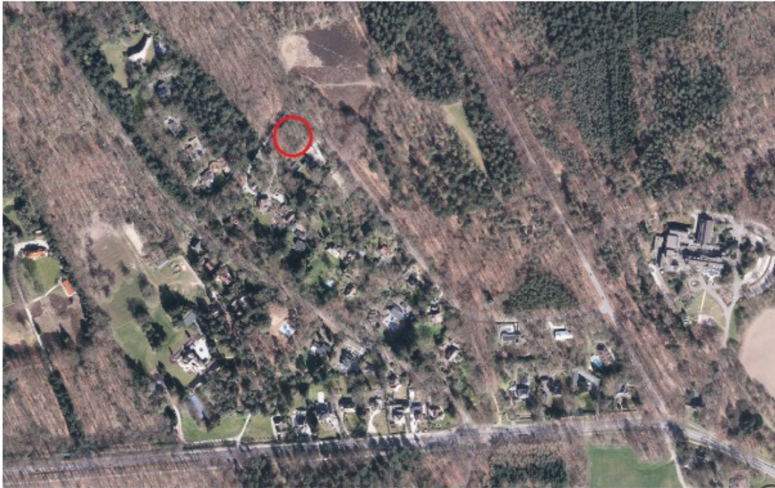
Afbeelding: globale ligging plangebied in het de wooncluster langs de Wolfhezerweg - Zonneheuvelweg - Utrechtseweg in buitengebied van Oosterbeek.