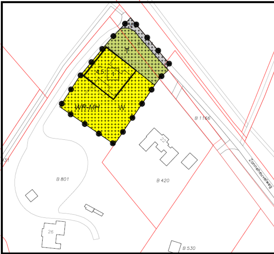
Afbeelding: verbetering voorliggend ontwerpbestemmingsplan 'Zonneheuvelweg 24, 2023'