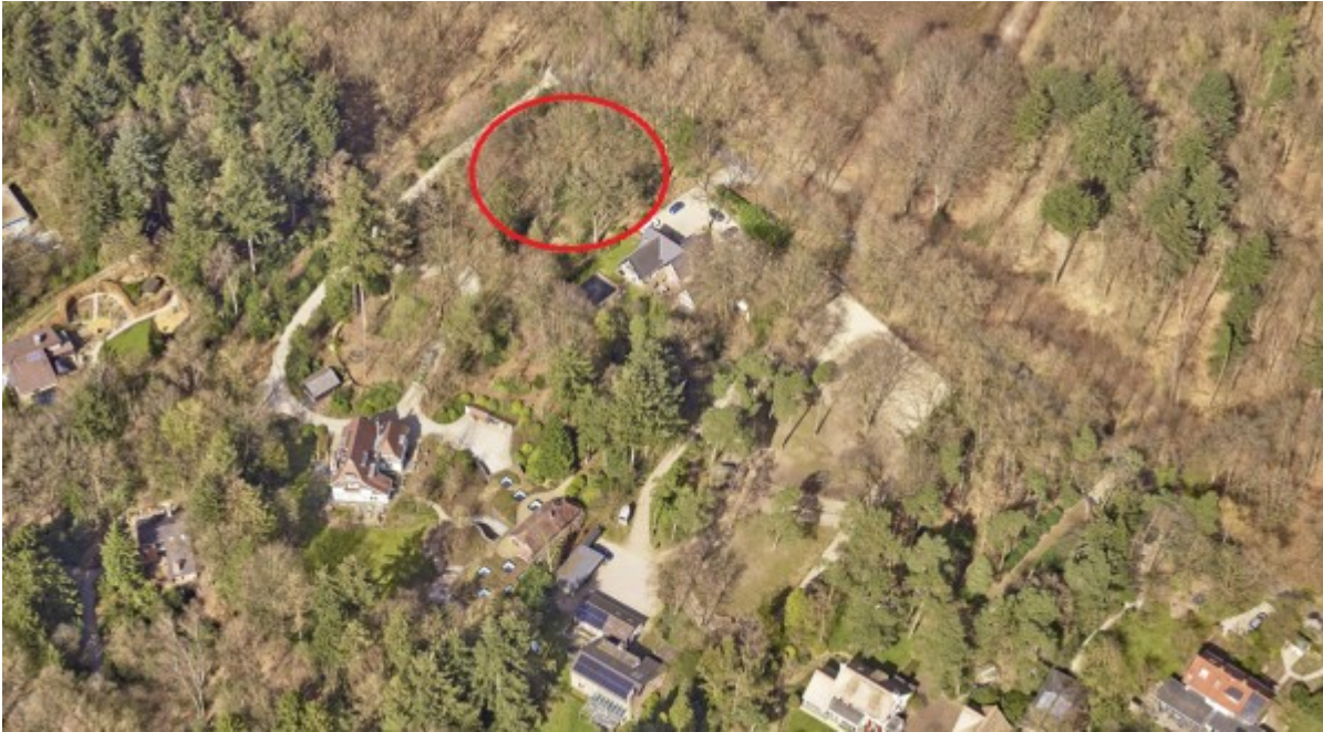
Afbeelding: luchtfoto 2021 plangebied, kijkrichting naar het noorden.