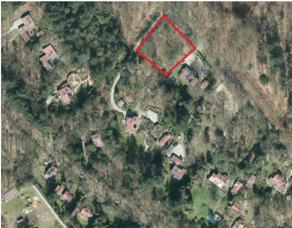
Afbeelding: ligging plangebied aan de Zonneheuvelweg. Voor de exacte begrenzing zie de verbeelding.