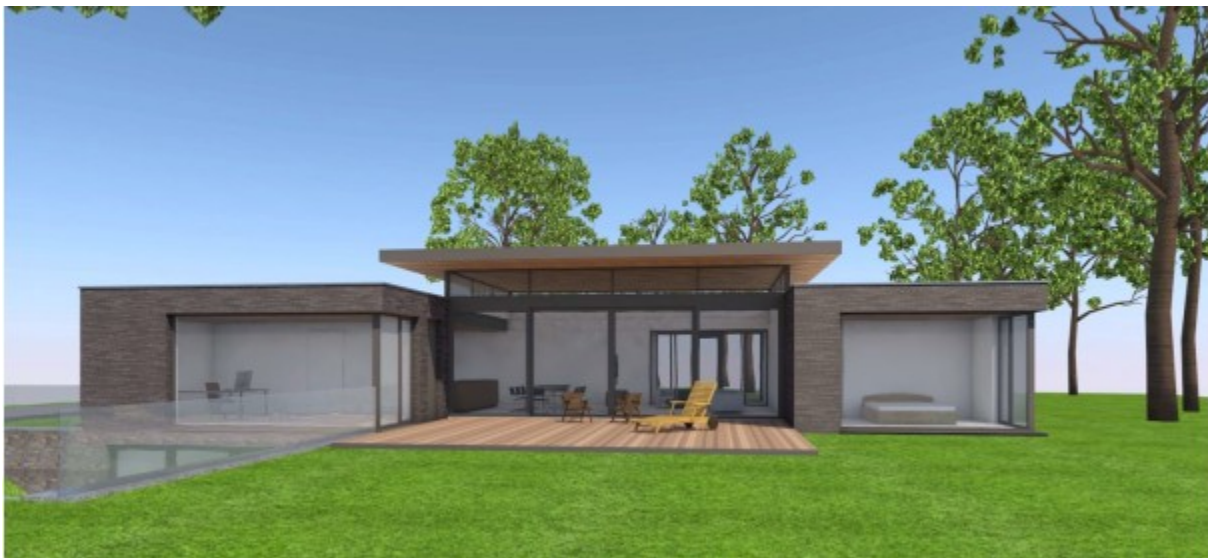
Afbeelding: Impressie nieuwe woning.