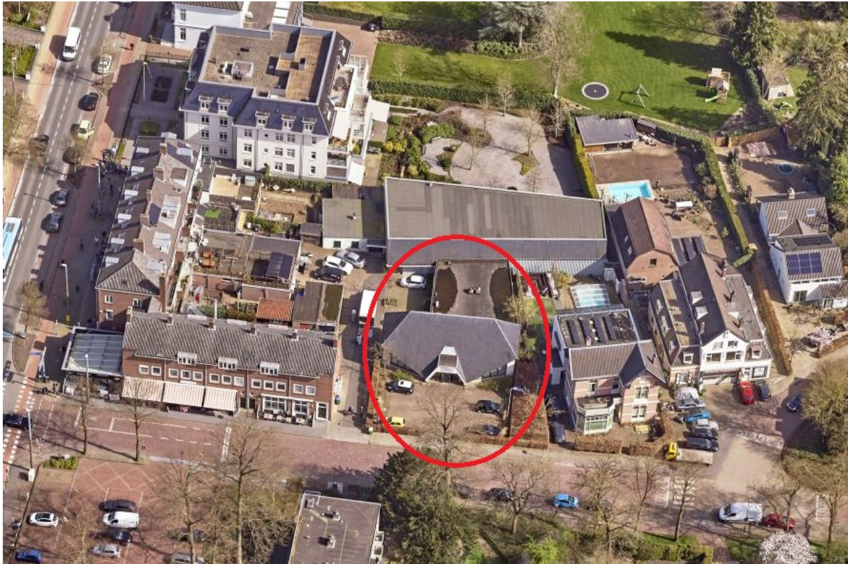
Locatie; 3D-luchtfoto, kijkrichting naar oosten