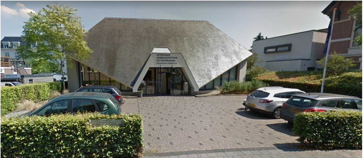
Pietersbergseweg 14