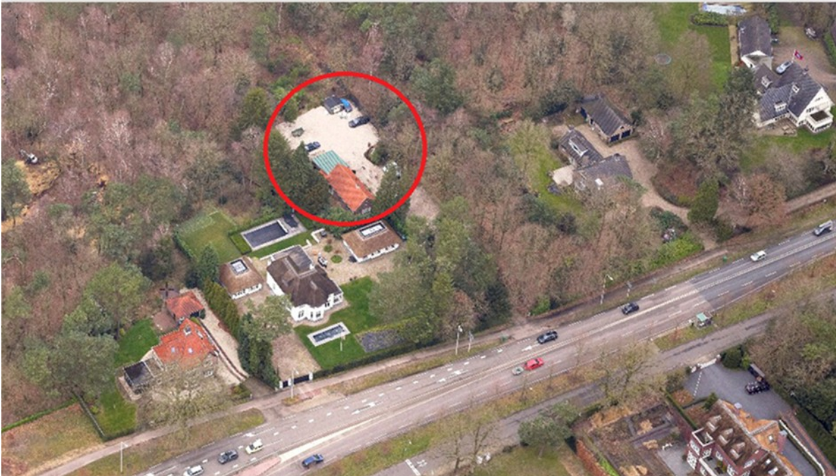
Afbeelding: obliëkfoto van planlocatie (rood omcirkeld)