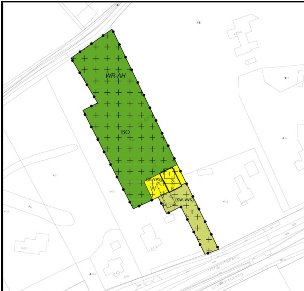
Afbeelding: plankaart bestemmingsplan 'Utrechtseweg 443a, 2022'

Daarin voorziet het nieuwe bestemmingsplan 'Utrechtseweg 443a, 2022'.