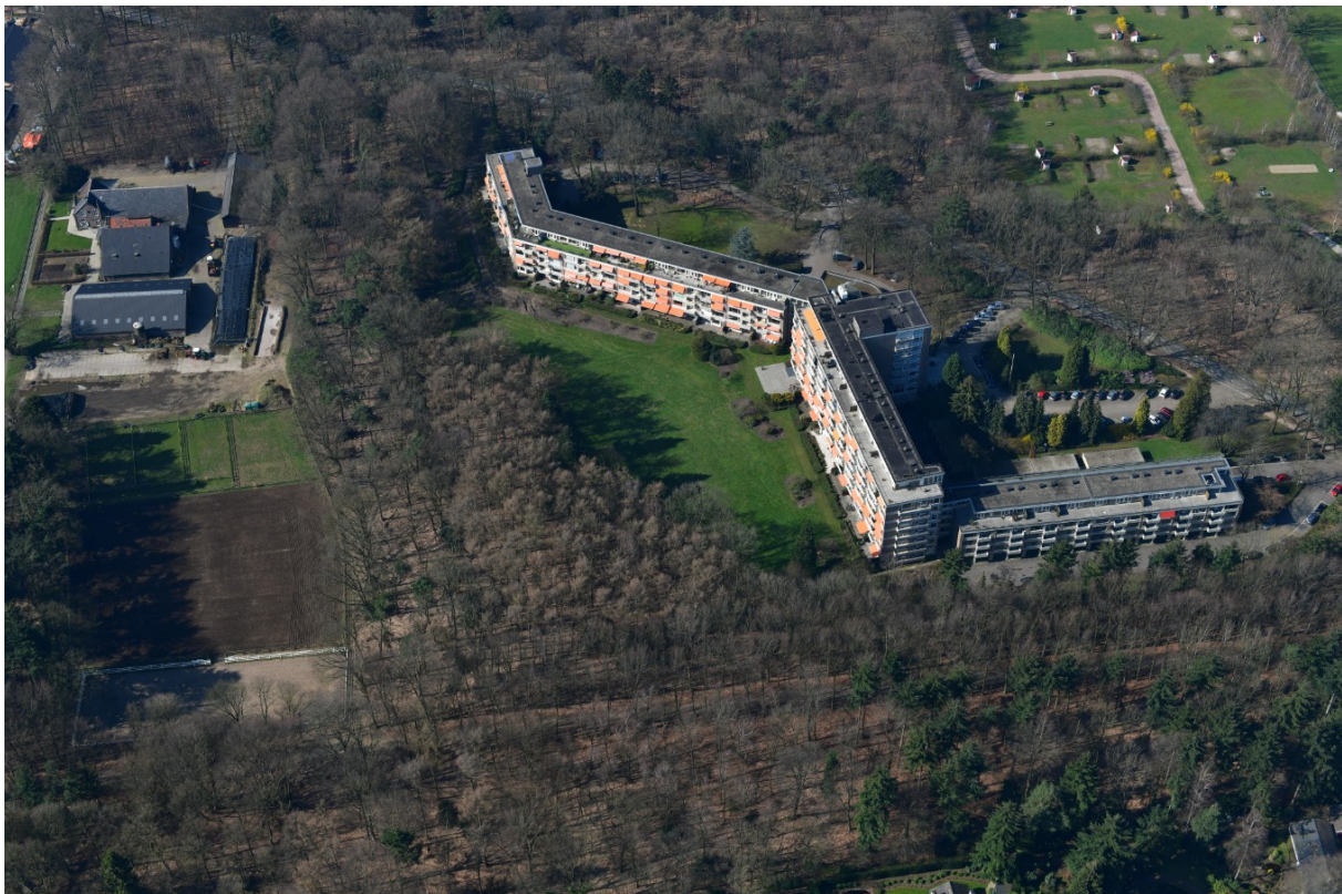
Huidige Valkenburcht in vogelvlucht