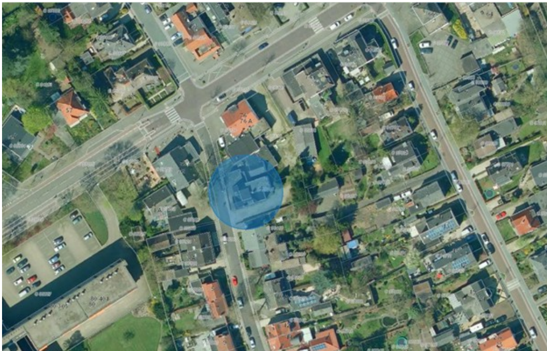
Fragment situatie 2016

De eigenaar van het pand aan de Kerkweg 4 te Heelsum heeft ons gevraagd om in te stemmen met het planologisch mogelijk maken van de bouw van een appartementencomplex met acht eenheden. Op dit moment staat er een gebouw dat lang dienst deed als kroeg met wonen op de verdieping. De kroeg is enige jaren geleden gesloten.