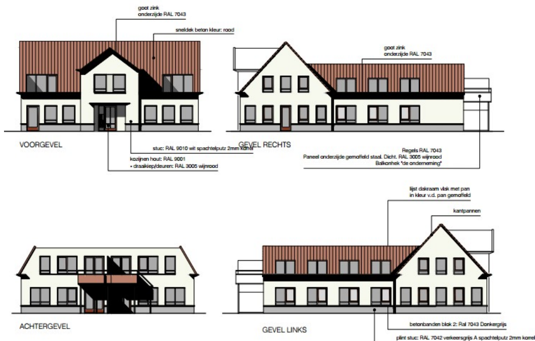
Gevelbeelden Kerkweg (Architect Frank van Haarlem B.N.A.)

Parkeren is geregeld in het ontwerp. De woonadviescommissie Renkum (Wac) heeft een aantal aanbevelingen gedaan en die zijn verwerkt door de ontwikkelaar. De welstandscommissie destijds alsook de huidige commissie Ruimtelijke Kwaliteit kunnen instemmen met het ontwerp (mits uitgevoerd met keramische dakpannen).