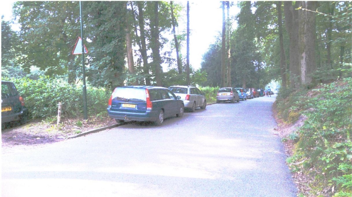
Figuur 1 Van Borsseleweg Culturele activiteit 24-07-2016