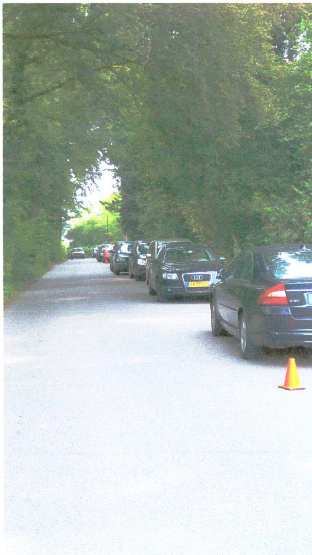
Figuur 2 Van Borsseleweg Culturele activiteit 24-07-2016

De afbeeldingen zijn genomen op de Van Borsseleweg. Figuur 1 kijkt naar het zuiden vanaf de tuin en figuur 2 kijkt naar het noorden. (Zie ook Bijlage 1)