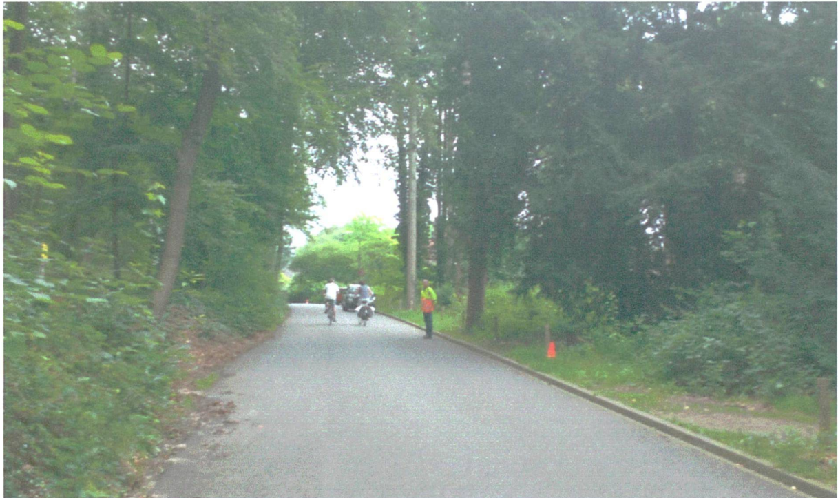
Figuur 3 Parkeren op 7 augustus voor aanvang bij TLO op de weg met verkeersregelaar

Op 7 augustus blijkt dat het parkeren voor Tuin de lage Oorsprong op de Van Borsseleweg nu standaard is geworden. Na 4 bezoeken vanuit Vijf Dorpen en diverse van omwonenden is parkeren voor de deur de norm. Er staat bij Pluryn geen bord meer om aldaar te gaan parkeren. De verkeersregelaars verwijzen bezoekers direct naar een plek langs de weg en op het fietspad naast Glock