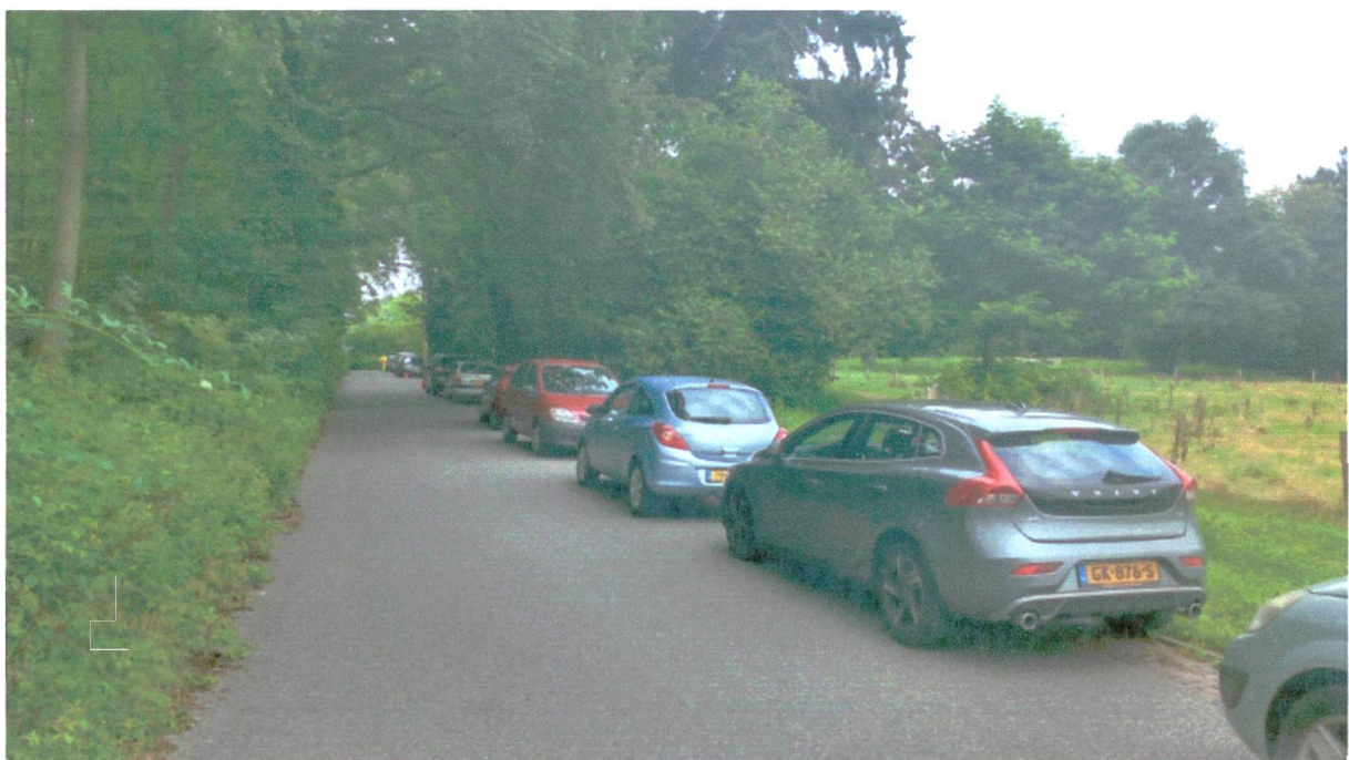
Figuur 4 Parkeren op 7 augustus. Rond 16:30. Ook weer met de verkeersregelaar actief