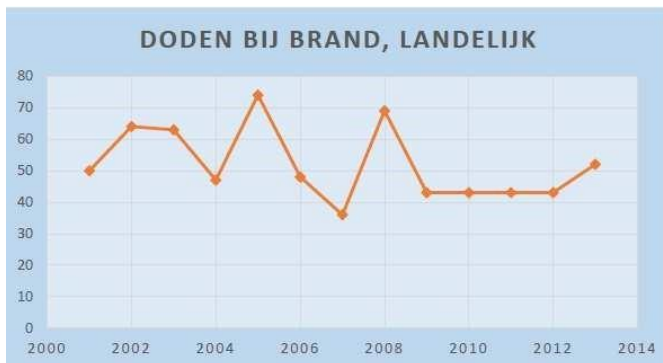
Figuur 1 Doden bij brand, landelijk

In Nederland vallen relatief weinig slachtoffers door brand; gemiddeld 52 slachtoffers en ca. 1.000 gewonden over de periode 2001 – 2013 (zie figuur 1). Dit is Europees gezien ver onder het gemiddelde. Het grootste deel van de slachtoffers valt bij woningbranden. Jaarlijks zijn er zo'n 6.000 woningbranden met ongeveer 40-60 doden, 600 gewonden en 250 miljoen euro brandschade. Meer dan 90% van alle doden en gewonden bij brand vallen in de woning. Ondanks het relatief lage aantal slachtoffers is de impact van brand zodanig dat te allen tijde gestreefd moet worden naar minimalisering van het aantal slachtoffers. Hieraan zit echter wel een grens: absolute veiligheid is een illusie.