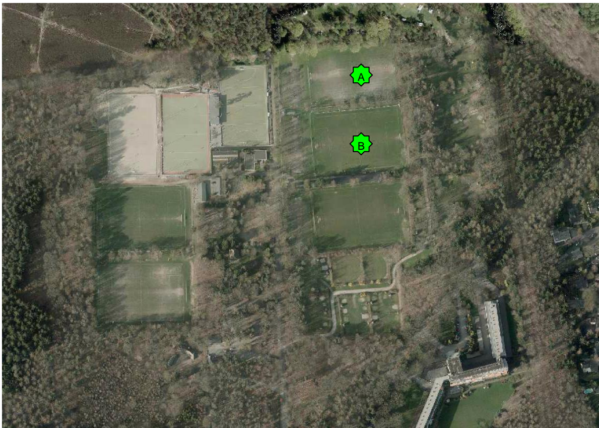
Figuur 1 Luchtfoto De Bilderberg sportvelden en stroken (2012-2013).

Om vanuit de actuele situatie verder te komen in de ontwikkeling van sport op De Bilderberg worden, alvorens de gezamenlijke visie van de hoofdgebruikers van het park te schetsen (hoofdstuk 4), eerst de aanknopingspunten en inpassing in de sportnota van de gemeente Renkum belicht in het volgende hoofdstuk.