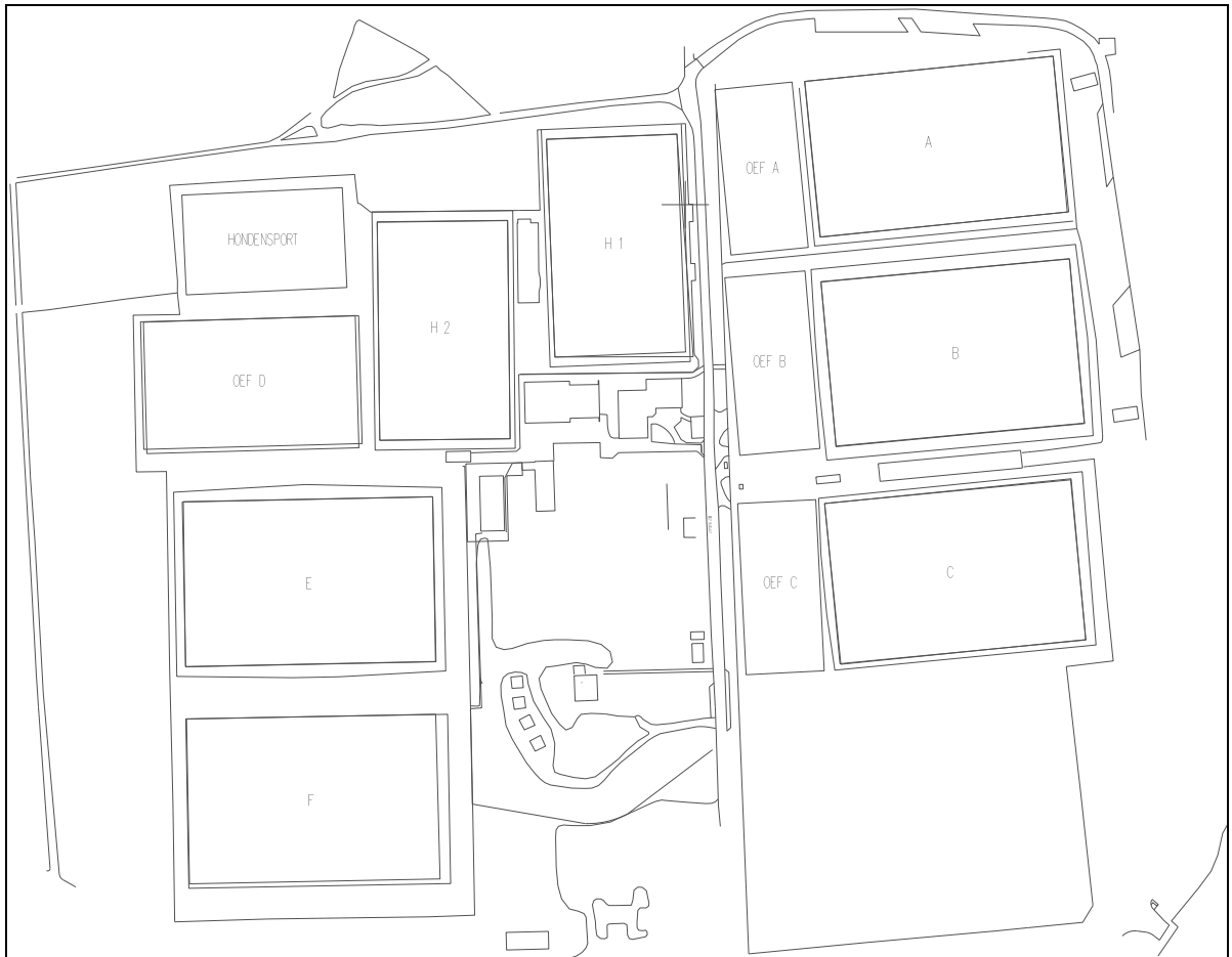
Figuur 2 Schematische weergave sportvelden De Bilderberg.