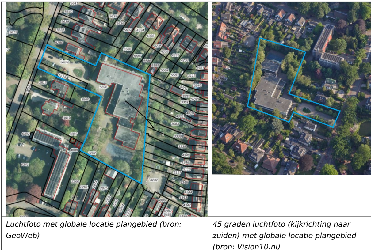
Luchtfoto met globale locatie plangebied