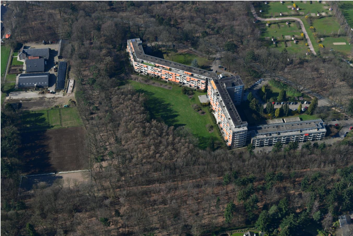
Huidige Valkenburcht in vogelvlucht