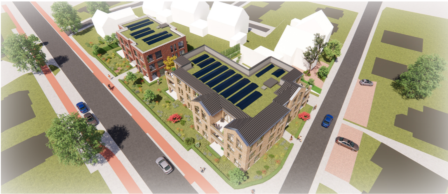
Inpassing nieuwe bebouwing in bestaande omgeving - Utrechtseweg / Noorderweg