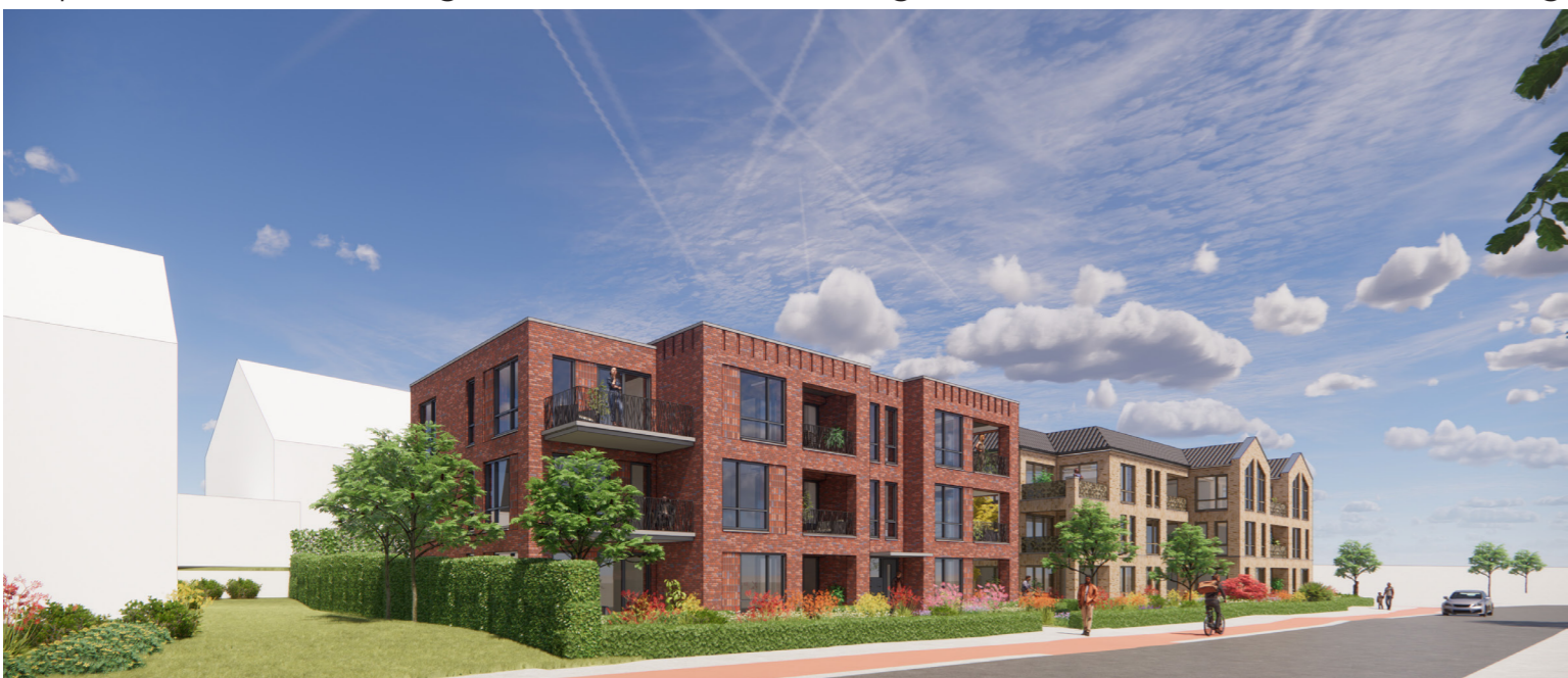
Nieuwe situatie met bestaande bebouwing - Utrechtseweg