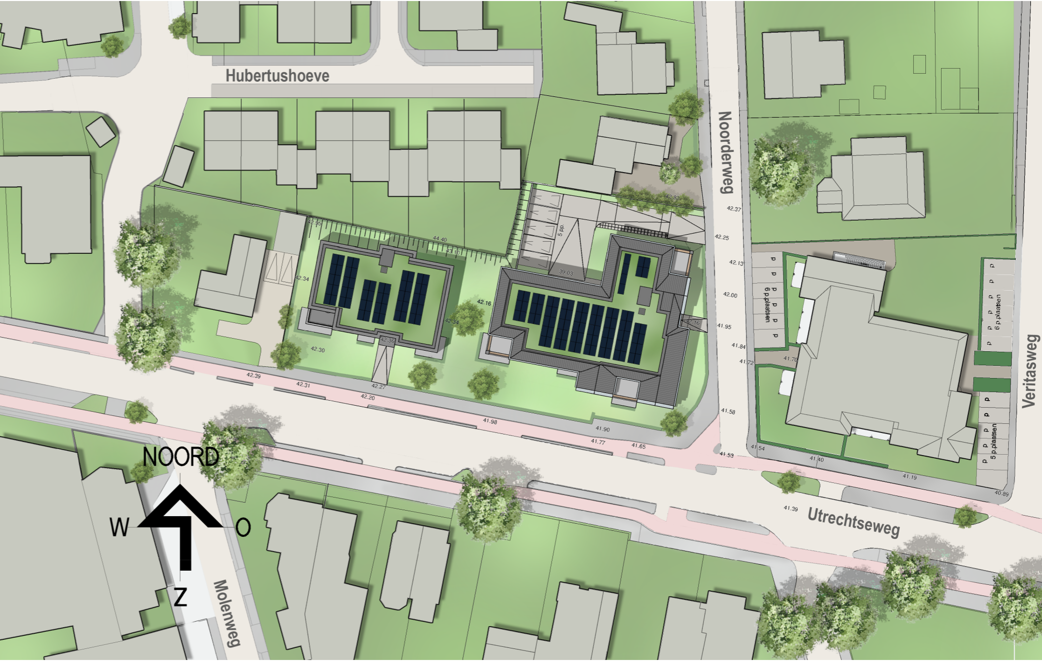
Nieuwe situatie en de omgeving Utrechtseweg, Oosterbeek

In het plan zijn 21 appartementen opgenomen, verdeeld over twee gebouwen. Het linkergebouw heeft 9 appartementen en het rechtergebouw heeft 12 appartementen. Parkeren wordt opgelost in een gemeenschappelijke stallingsgarage met 27 parkeerplaatsen en op het terrein worden 5 extra parkeerplaatsen gerealiseerd. Het gebied rondom de twee gebouwen wordt ingericht als tuin.