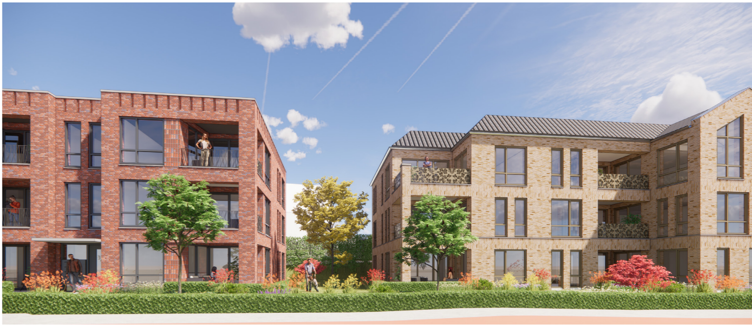
Tuininrichting gebied rondom nieuwe bebouwing - Utrechtseweg