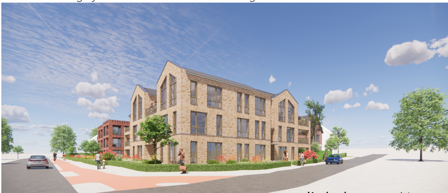
Uitgangspunt is een duidelijke alzijdige hoekoplossing weusten liedenbaum architecten