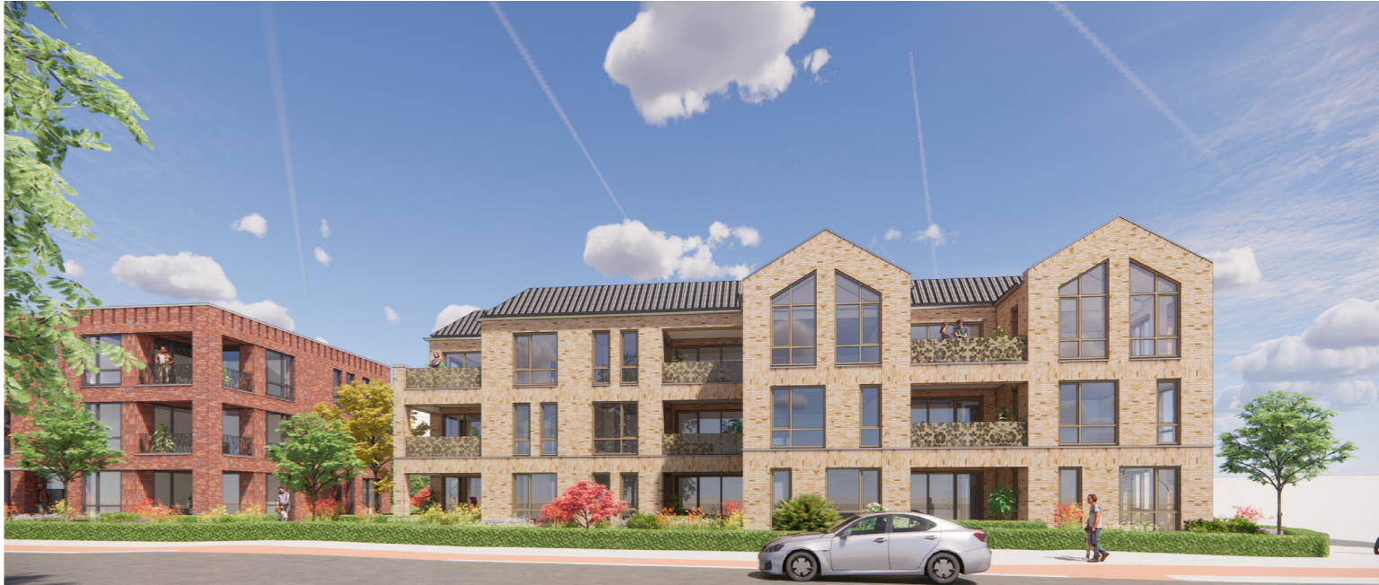
Indicatie van mogelijk architectuurbeeld - Utrechtseweg