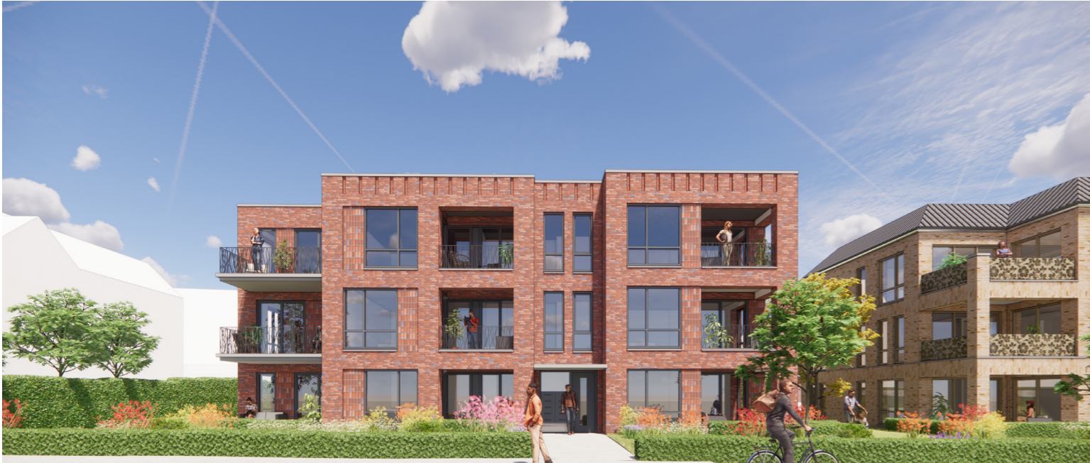
Toepassen van onderbreking in bouwvolume om een te grote schaal te voorkomen - Utrechtseweg