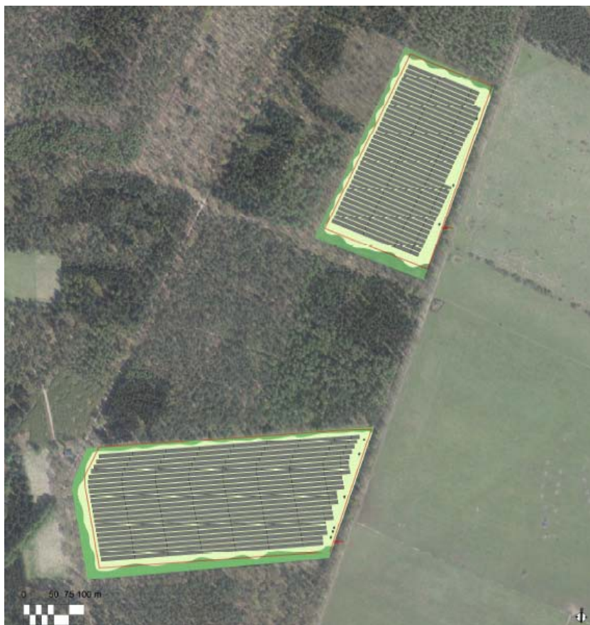
Afbeelding: Weergave inrichtingsplan van de twee zonnevelden