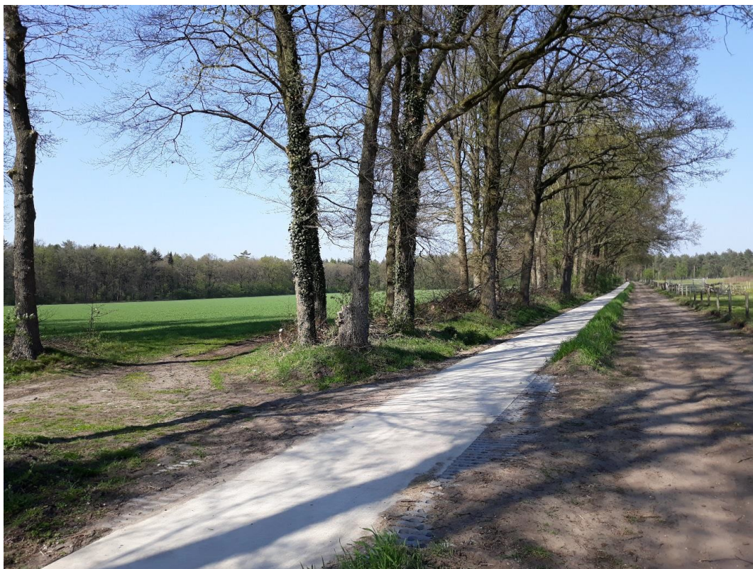
Foto: Singel op de grens van de percelen en het open gebied met links een onverharde weg en rechts grenzend aan het open landschap een fietspad