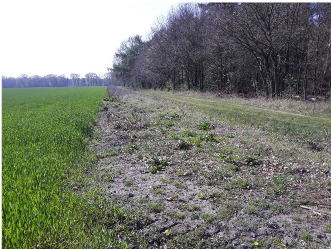
Foto: Huidige niet geleidelijke grens tussen bos en landbouwgebied waar volgens het ontwerp een bosmantel zal worden ontwikkeld ten behoeve van een geleidelijke overgang.