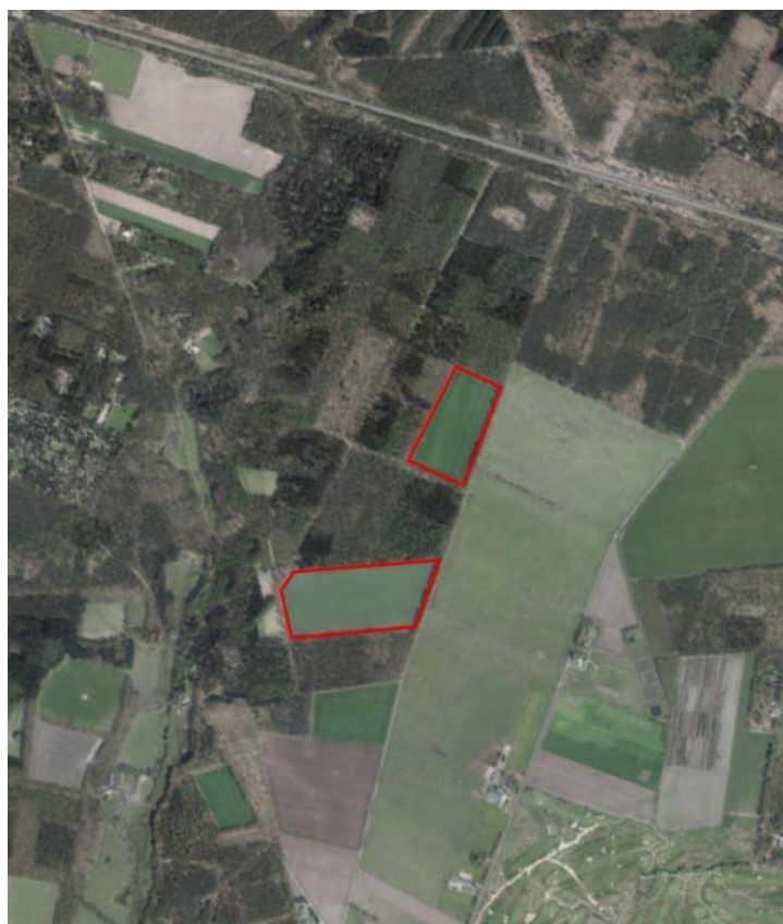
Afbeelding: Ligging van het plangebied met rode omlijning aangegeven