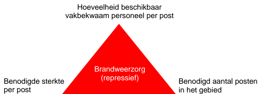
Figuur 2: Pijlers repressieve brandweezorg

Door de veranderingen kan de balans hoeveelheid beschikbaar vakbekwaam personeel, benodigde sterkte per post—en benodigd aantal posten in het gebied onder spanning komen te staan. Onderstaande afbeelding geeft de pijlers van de repressieve brandweezorg weer. Verandering van één van de pijlers heeft direct invloed op de overige twee.