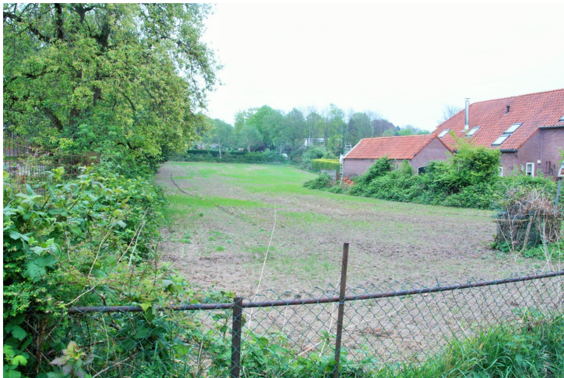
Planlocatie gezien vanaf het Stenenkruis met rechts de bestaande woning.

Het beeldkwaliteitsplan geldt voor de vrijstaande woning, maar kan niet los worden gezien van het stedenbouwkundig plan. Dit ondanks het feit dat de ontwikkeling van het plan is voorlopig opgeschort.