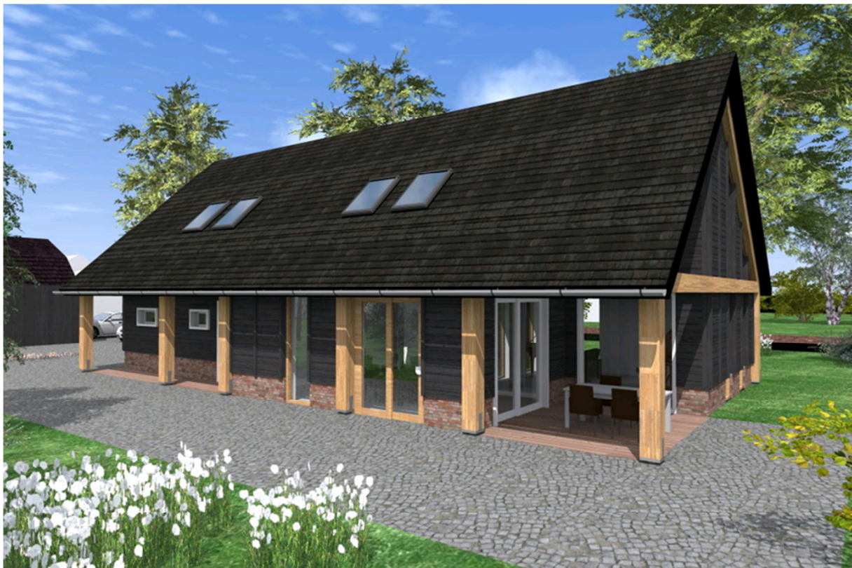
Moderne referentie woning Stenenkruis nummer 14

Het gebruik van een harde afscheiding is ongewenst. De privacy kan door de positionering van de woning en de omvang van de tuin voldoende gewaarborgd. Voor de erfafscheidingsen kan gebruik worden gemaakt van hagen, bij voorkeur beukenhagen, met een maximum hoogte van 1,80 meter.