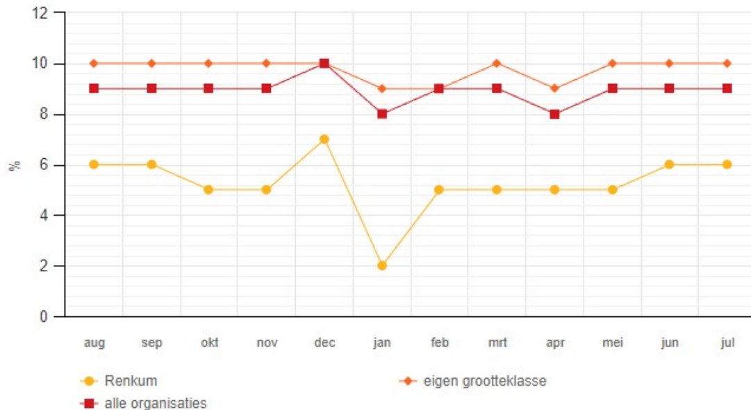
Grafiek: Percentage klanten dat parttime werkt

De grafiek toont het aandeel klanten met inkomsten uit parttime werk naast de bijstandsuitkering.